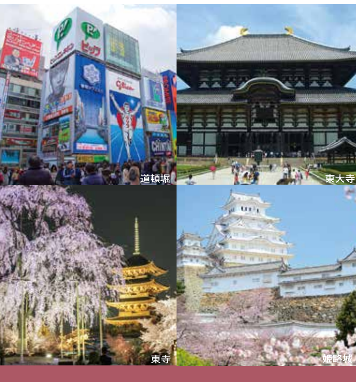
ホテルアストンプラザ関西空港から関西の観光スポットへ